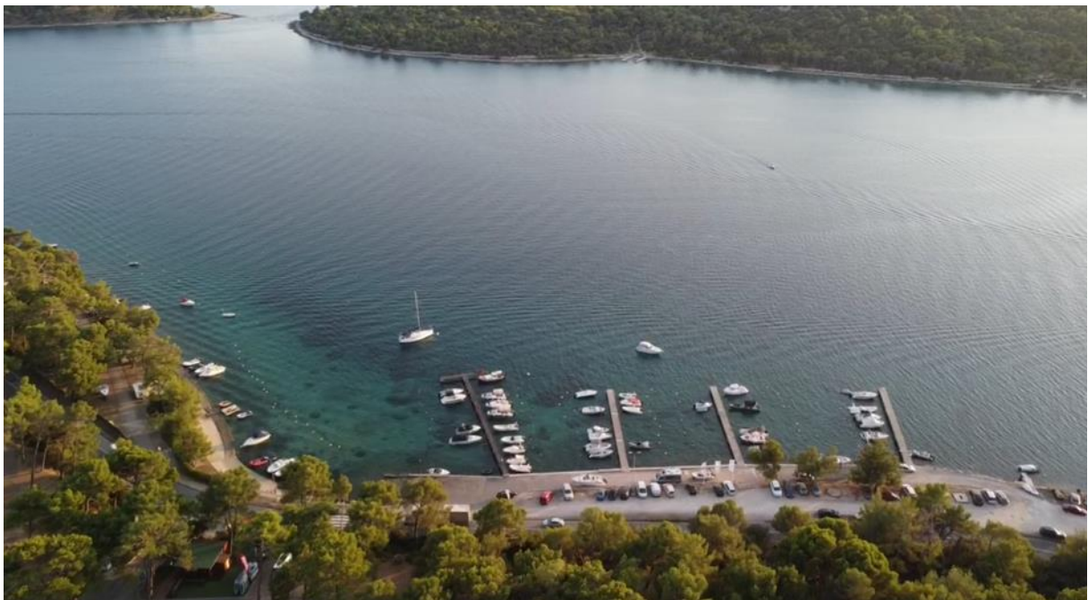
Bild: 5 Liegeplätze und Kran am Camp Poljana