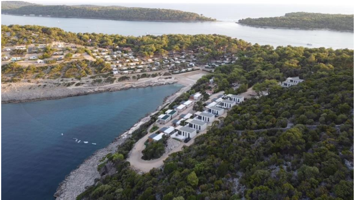
Bild: 4 Camping Village Poljana