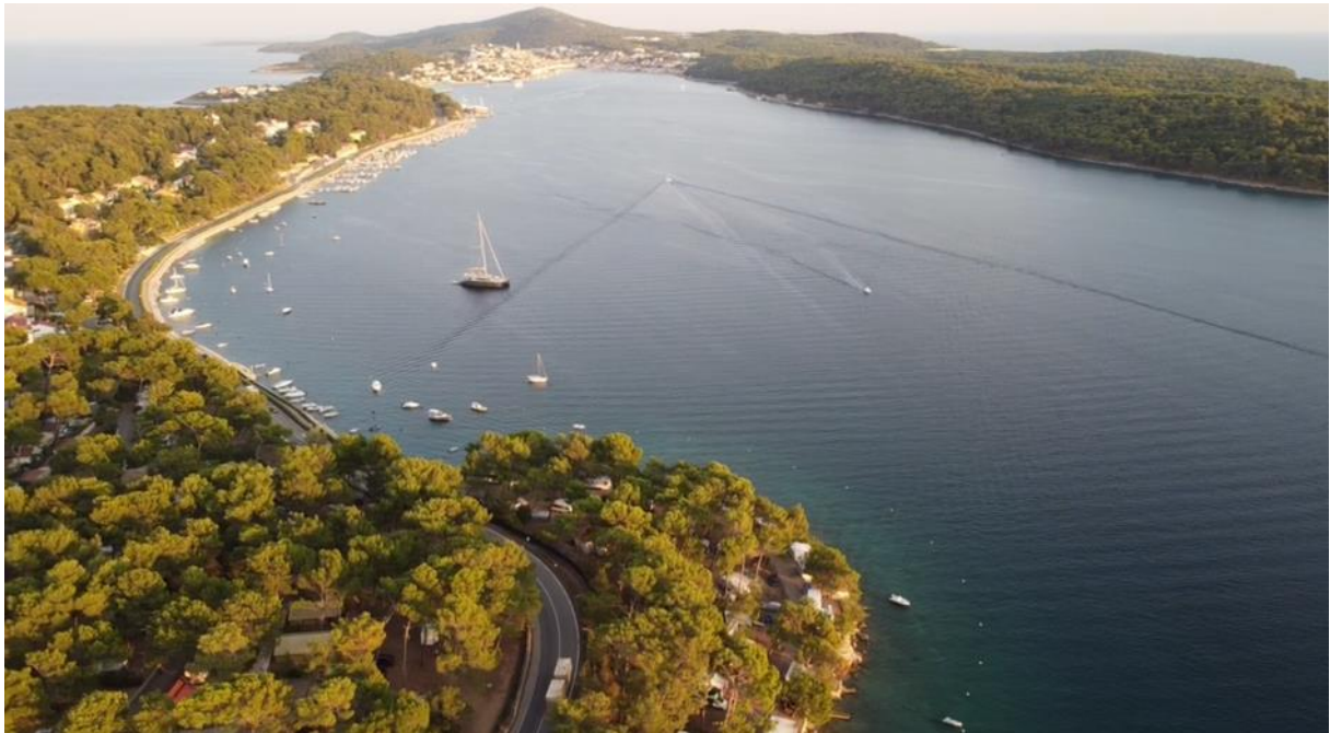
Bild: 2 Bucht von Mali Lošinj