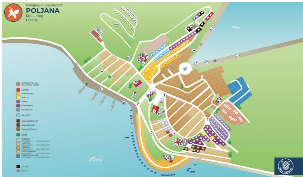
Bild: 3 Camp Poljana