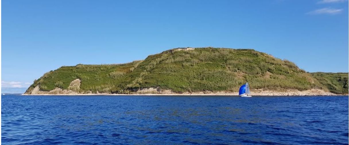
Bild: 6 Seascape Rund Susak

Unsere Cruising Woche von 13.08. – 20.08.2022 lässt sich in idealer Weise mit den First Seascape Europeans 2022 im slowenischen Portoroz und den davor liegenden Slovenian Open verbinden!